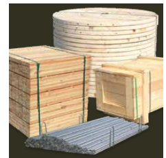
Bausätze für die Vorortmontage

Für unsere Spulen aus Holz verarbeiten wir je nach Anforderung unbehandeltes, IPPC behandeltes oder kesseldruckimprägniertes Nadelschnittholz aus nachhaltiger Forstwirtschaft, welches PEFC zertifiziert ist.