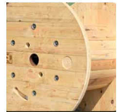
Versandspule fertig montiert