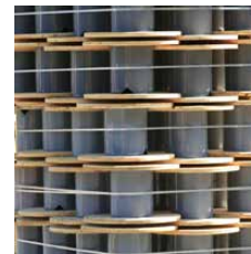
Kunststoffkern als Kundenwunsch