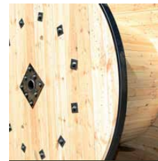
Eisenbereifung als Mehrwegspule